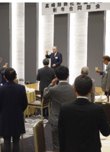
組合員が一堂に会した新年合同部会

組合員の新年初顔合わせや組合現況報告等を兼ねた恒例の新年合同部会が、1月17日(火) 午後6時より、ホテルメトロポリタン高崎で開催された。 毎年年初に開催されていたが、コロナ禍の影響により3年振りの開催となった。当日は、組合員の他、組合顧問など52人が出席した。事務局より問屋街の現況と今後の予定が報告され、