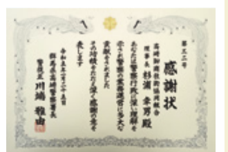
高崎警察署からの感謝状

高崎警察署から組合に対し感謝状が贈られた。 組合は日頃から地域貢献の一環として、夜間防犯・交通安全パトロール等警察活動に協力。まちづくり事業においては、問屋町地区計画を制定し、ビジネスとコミュニティが融合した街を実現している。また、防犯カメラ付き街路灯91本を設置する等、安全安心な環境づくりに貢献している。これら活動に対して、警察から感謝の意が伝えられたものである。