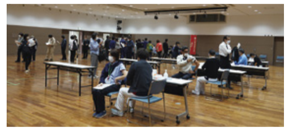
大きな会場で3密を避けて実施

組合に会場を設け、費用の多くを助成して行う今期のインフルエンザ集団予防接種が終了した。 10月から12月にかけて3回、組合員・賛助会員の役員を対象に、ビエント高崎本館のエクセルホールにおいて、3密を避けるべく接種の時間帯も分散するなどコロナ対策を徹底して実施した。 今期は、72社・1,248人が接種した。長引くコロナ禍の中、インフルエンザ予防への意識が高いことがうかがえた。 接種に当たっては、例年