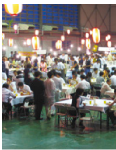
毎回大人気のヒアパーティー(上) ディズニーツアー(下)

問屋街夏の年中行事ヒアパーティー。今年も問屋街センター・展示会館を会場に七月二十九日(水)の夜に行われる。