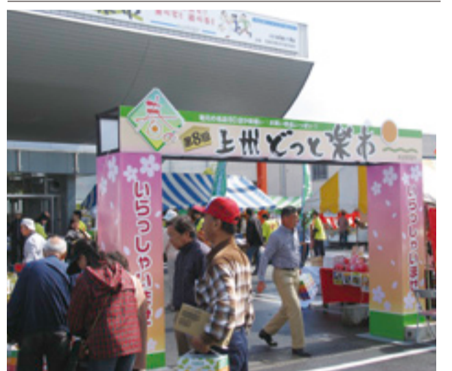
初日の雨にもかかわらず2日間で25,000人が来場した春の楽市

この秋も、「二〇〇九年秋の上州どつと楽市」と称し、十月三十一日(土)・十一月一日(日)の二日間通算九回目の楽市を実施する。これに先立ち、七、八月に出店者募集を行う予定である。