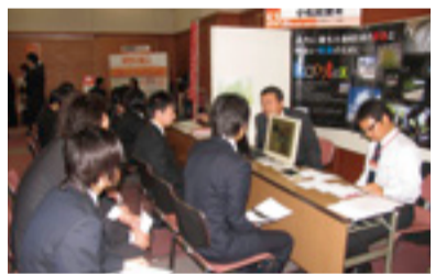
問屋街各社のブースも大人気

今年も例年に引き続き就職情報サイト「マイナビ」に乗り合い事業を行っている。その一環として「就活応援団合同会社説明会」が四月二十四日(金)正午よりグリーンホール前橋で行われ、問屋街からも十社が参加した。