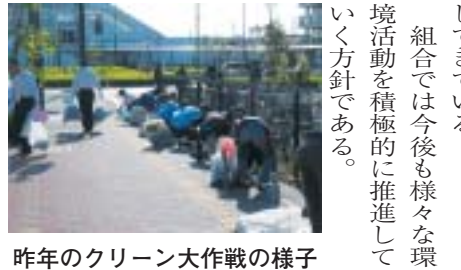
昨年のクリーン大作戦の様子

問屋街センターのご利用を。 （本館・エクセルホール・展示会館） 会議に、研修会に、展示会に駐車場完備の問屋街センターのご利用を 申込み問合せ先 ☎027-361-8243(代) http://www.viento-takasaki.or.jp/ e-mail:viento@viento-takasaki.or.jp