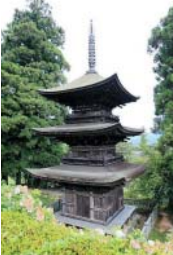
国宝大法寺三重塔も見処のひとつ

例年大好評の問屋街史跡めぐり、今回は「北向き観音と善光寺」(信州国宝めぐり)と題して、十一月十六日(日)に実施する。長野県には五つの国宝建