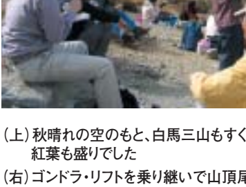
（上）秋晴れの空のもと、白馬三山もすぐ目の前に紅葉も盛りだ

秋の盛りりの高原ハイキングの醍醐味を満喫した。参加者は、「登りがちょっときつかったけれど来てよかった。」「もう一度来てみたい」と感想を洩らしていた。