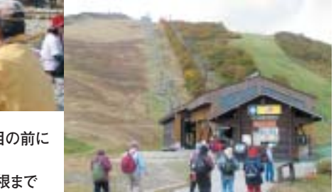
（右）ゴンドラ・リフトを乗り継いで山頂尾根まで

秋の盛りりの高原ハイキングの醍醐味を満喫した。参加者は、「登りがちょっときつかったけれど来てよかった。」「もう一度来てみたい」と感想を洩らしていた。