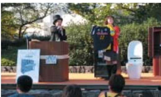
オークションも大好評（問屋町公園ステージ）

上州どつと楽市が、十月二十七日（土）・二十八日（日）の二日間、高崎問屋街センターおよび問屋町公園を会場に開催され、高崎問屋街の卸商社を中心とする八百六十店が出店した。 衣食住の文化を発信することを通じて高崎問屋町周辺に新たなにぎわいを創出することを目的に始められた同市も今回で通算五回目となり、高崎問屋町の年中行事として県民にも知られ定着してきている。 毎回三万人前後の来場者があり、今回も多くは来場者が期待されたが、残念ながら初日（二十七日）は朝から台風の影響による雨であった。しかし、朝九時か