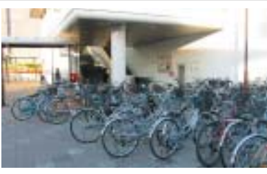
マナー悪い駐輪で溢れる問屋町駅

しかし、両駅前とも連日数百台の放置自転車で溢れている。身障者用の黄色い点字ブロックの上に駐輪する、エレベーター・エスカレーターの入出口をふさぐように駐輪するといっ