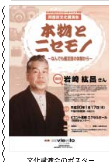
文化講演会のポスター