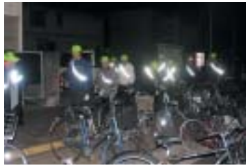
12月6日（木）の夜間防犯パトロール

当日は三班に分かれ清掃作業を行った。歩道や公園野球場そして駅前広場のゴミ・空き缶拾いまた除草も行った。結果、約百袋のゴミが集められた。雑草が大半であった。