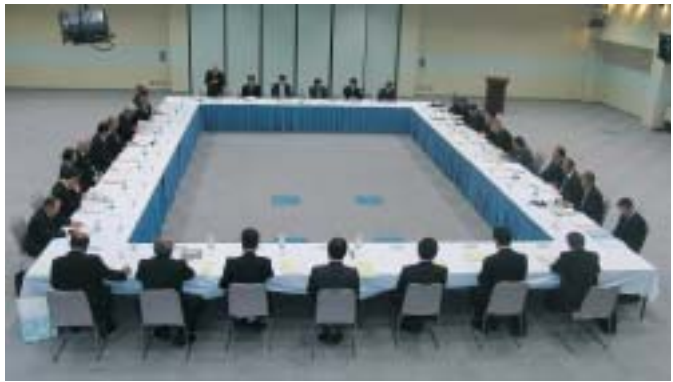
11月29日（木）午後、エクセルホールで行われた商団連の関東ブロック会議

も出席、参加者は総勢三十一団体四十名にのぼった。 当日、午後一時に高崎問屋街センターに集結した二行は、はじめにバスで高崎問屋団地内を視察し、その後、後会談に入った。