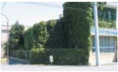
問屋町での壁面緑化の例

「卸商社街四十haまるごとCO2削減による街の品格向上計画策定」と題し行われる今回の調査事業は、①卸商社街全体としての環境負荷の現状把握、②屋上緑化・壁面緑化等によるCO2排出の削減、③CO2削減対策導入に必要な事業費の算定と組合員個々の