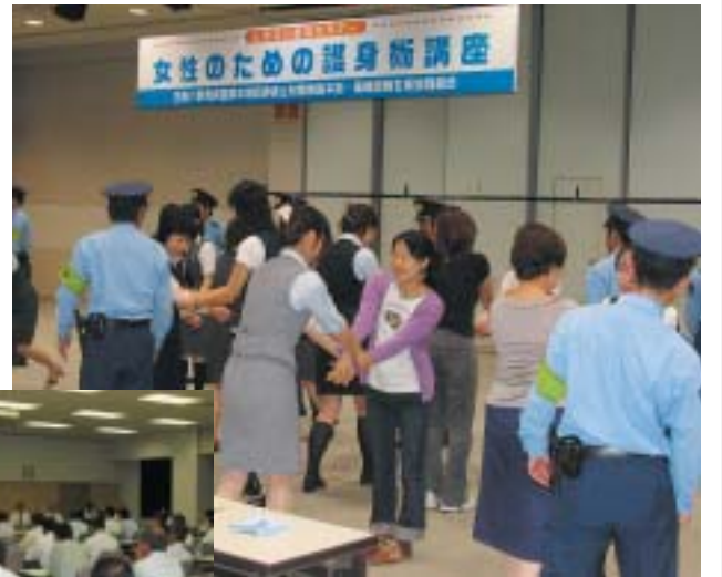
(上) 女性のための護身術講座には機動隊員も参加した (左) 80名参加した不当要求防止責任者講習会

また、八月二十一日（水）には、「不当要求防止責任者講習会」が行われた。こちらは暴対法に規定された講習会であり、群馬県警・暴力追放県民会議と共催により行われ、組合各社の代表者・総務担当者など八十名が受講した。